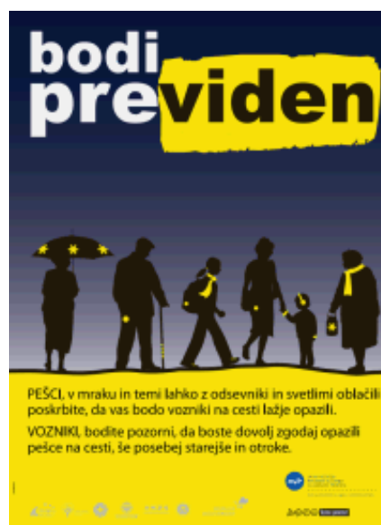
Plakat opozarja na vidnost pešcev